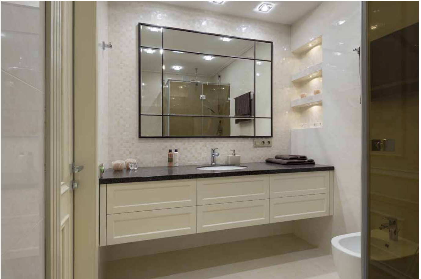
Санузлы, отделанные изысканной плиткой, поддерживают основную интерьерную концепцию, но при этом имеют стильное современное освещение

со стульями из натурального дерева итальянского производителя. Вся остальная корпусная мебель спроектирована индивидуально и реализована по эскизам автора украинской компанией «Элио». Двери и элегантная угловая раздвижная перегородка, отделяющая кабинет от гостиной с кухней, также созданы по индивидуальным эскизам. В самом же кабинете внимание привлекает отделка стены – это эксклюзивные текстильные 3D-обои Arte, сочетающие в себе одновременно и гладкость, и рельефность.