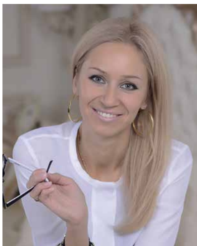
Автор проекта дизайнер интерьеров Алена Сергиенко

Столовая группа изящно дополняет настроение пространства. Обеденный стол со стульями из натурального дерева итальянской марки приобретены в салоне интерьеров FREEDOM